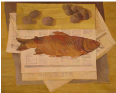
Rogério Ribeiro, 1992